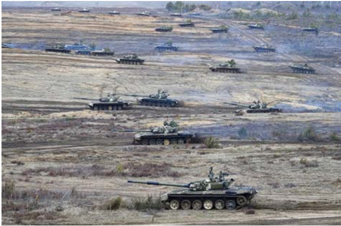
Despliegue de vehículos blindados.

El plan de campaña ruso original era una guerra de maniobras clásica a nivel operativo. Stavka (1) se ha centrado en el arte operativo desde antes de la 2da GM, de hecho, en cierto modo, desde el período zarista. Pero como dije en una columna anterior, (2) el ejército ruso en Ucrania cayó en una trampa de su propia creación: sus unidades no pudieron cumplir en el nivel táctico lo que el plan de campaña requería en el nivel operativo. Esto no es exclusivo de los rusos. En la Primera Guerra del Golfo Pérsico, el Séptimo Cuerpo del Ejército de los EEUU no pudo moverse lo suficientemente rápido tácticamente para lograr su objetivo operativo, el cerco de la Guardia Republicana de Irak. En la 1ra GM, mi general alemán favorito, Max Hoffman, dijo del jefe del estado mayor austrohúngaro, Conrad von Hotzendorf, que sus planes eran operacionalmente brillantes pero que su ejército no podía ejecutarlos. Eso plantea la cuestión de si un plan para un ejército que no puede hacerlo es un buen plan. Tiendo a pensar que no. Del lado ucraniano, el "Wall Street Journal" del 14 de abril, en un artículo de Daniel Michaels titulado "Entrenamiento de la OTAN reformado el ejército de Ucrania", informó que: "Los países de la OTAN también ayudaron a los líderes militares ucranianos a adoptar un enfoque llamado misión común, en el que los altos mandos establecen objetivos de combate y delegan la toma de decisiones en los niveles inferiores de la cadena de mando, incluso en soldados individuales".