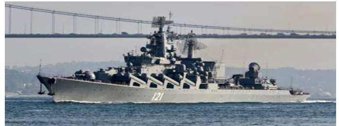
El crucero de misiles guiados de la Armada rusa Moskva navega en el Bósforo, en su camino hacia el mar Mediterráneo, en Estambul, Turquía, el 18 de junio de 2021. Foto tomada el 18 de junio de

No está claro, pero algunos analistas dicen que puede haber ayudado a respaldar un posible desembarco anfíbio ruso en el puerto ucraniano de Odesa que aún no ha ocurrido debido a la resistencia de las fuerzas ucrainas.