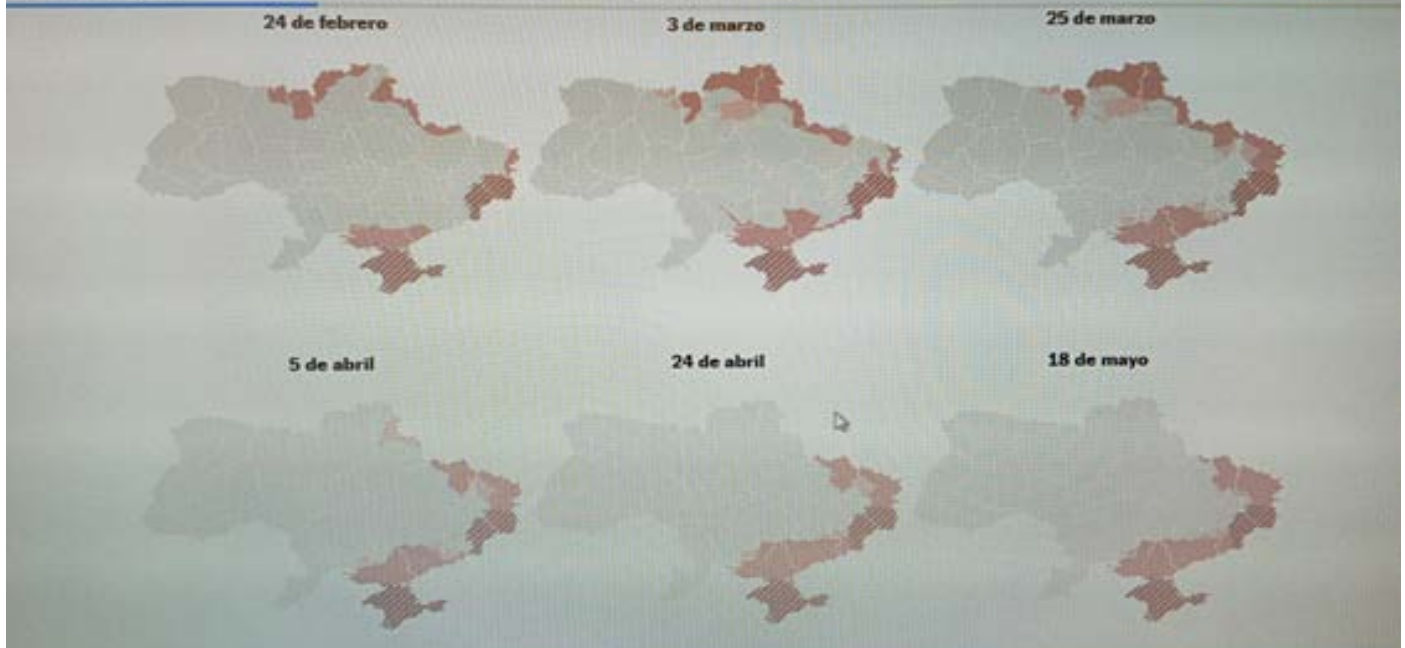
Representación gráfica de la evolución del conflicto desde el 24/2 al 18/5

mente desde 2014, y las áreas separatistas prorrusas en las provincias de Donetsk y Lugansk. La rendición [esta semana] de los combatientes que quedaban en la acería Azovstal, en Mariupol, permite a Moscú ejercer su control en toda la costa ucraniana del mar de Azov. El avance ruso se encuentra estancado desde hace semanas en el este y el sur del país, pero controla gran parte de las provincias ucranianas de Jersón, Zaporíyia, Donetsk, Lugansk y Járkov. Aun con reveses, el territorio ucraniano sometido actualmente es mucho más amplio que el que estaba bajo influencia rusa antes de la invasión.