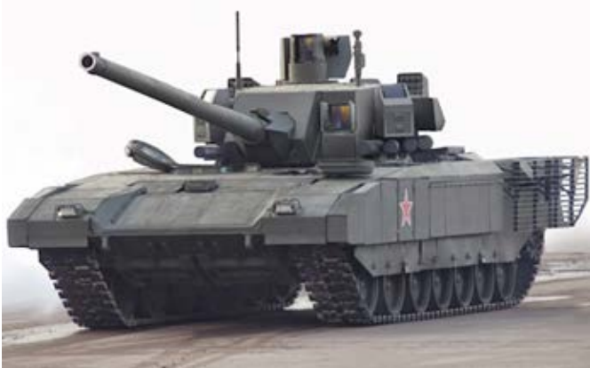
Vehículo Blindado T-14 ARMATA

En cuanto a los medios más “convencionales”, desde el inicio de las operaciones los rusos han utilizado los tanques T-72B3M y los de las series T-80 y T-90, que están equipados con sistemas de protección ERA (Explosive Reactive Armor, que es una armadura reactiva explosiva) del tipo Kontakt-5 y Relikt, consideradas muy avanzadas hasta febrero pero que no eran lo suficientemente adecuadas para hacer frente a las nuevas amenazas de los temibles misiles contracarro occidentales, por ejemplo los Javelins.