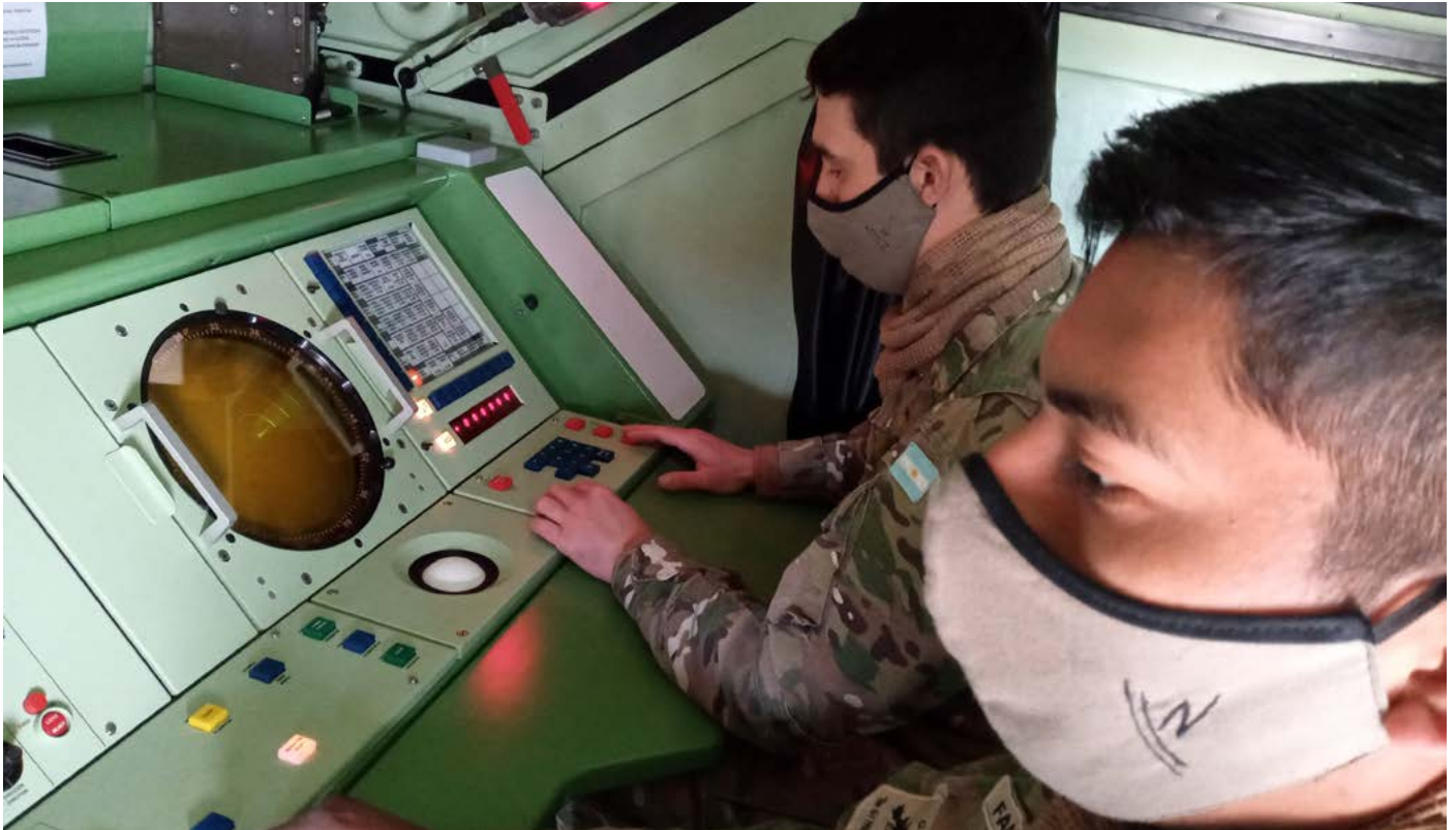
En la Agrupación de Artillería Antiaérea del Ejército 601 - Escuela finalizaron los Cursos Jefe de Sección de Alarma Temprana y Operador de Radar de Vigilancia Aérea, impartidos en el ámbito de la Dirección de Educación Operacional .

Presentamos hoy la edición decimoctava de este Observatorio por el cual la Escuela Superior de Guerra Conjunta quiere hacer un aporte al conocimiento sobre la pandemia del COVID19. El militar se prepara para conflictos futuros y sólo con el conocimiento de la actualidad y su análisis puede encararlos con éxito, siendo ello la esencia de la estrategia.